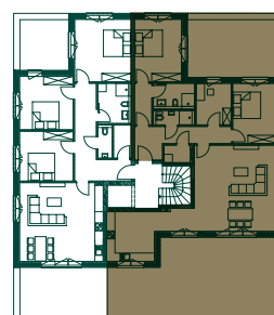
LAGE IM GESCHOSS