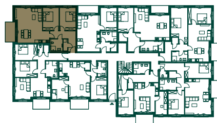
LAGE IM GESCHOSS